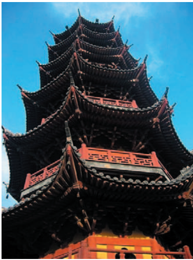
Long-Hua-Pagode, ehemaliges Zentralgebäude des Seezolls

Shanghai ist die größte Stadt in China und bedeutet in etwa „Stadt über dem Meer“. Sie hat ca. 9 Millionen Einwohner. Das besondere daran ist, dass jeweils ca. 17.000 Menschen auf einem Quadratkilometer wohnen. Wie das geht? Übereinander natürlich, in Hochhäusern.