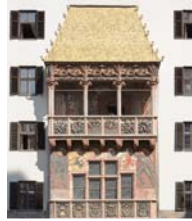
Innsbruck Goldenes Dachl

In diesem Bundesland kann man 365 Tage im Jahr Skifahren: