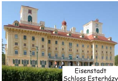
Eisenstadt Schloss Esterházy

Dieses Bundesland hat einen sehr bekannten See: