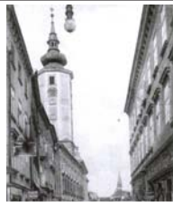
St. Pölten Rathaus