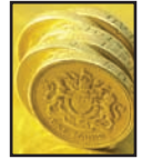
Bezahlt wird mit pounds

Größe: 244 100 km 2 Bevölkerung: 60,5 Mio Hauptstadt: London