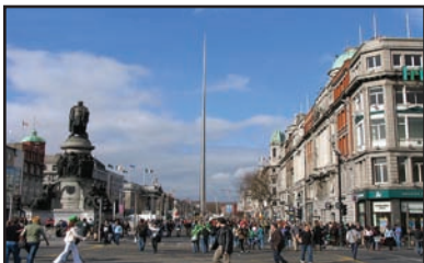
die Hauptstadt Dublin

Der Eurotunnel verbindet England mit dem europäischen Festland. Für die 50 km lange Strecke (ca. 40 m unter dem Meeresgrund!) brauchen die Züge nur 35 Minuten!