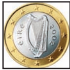
Harfe auf der Euro Münze.

Größe: 70 300 km 2 Bevölkerung: 4,3 Mio Hauptstadt: Dublin