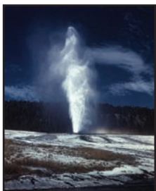
Geysir (heiße Quelle)