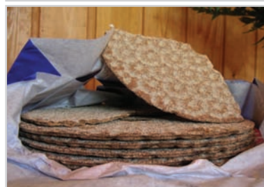
typisch schwedisch: das Knäckebröd